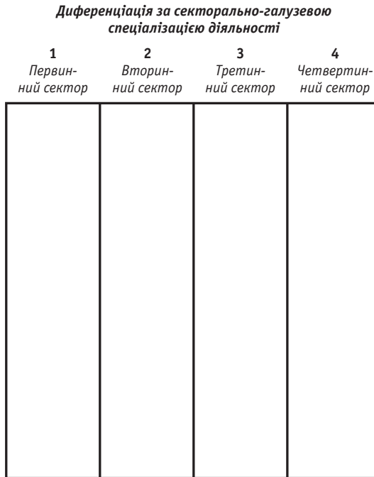
Рис. 2. Диференціація власників за секторально-галузевою спеціалізацією економічної діяльності

Диференціація класу власників відповідно до секторів економіки закладена й у низці емпіричних класових схем. Так, Г.Еспін-Андерсен розміщає їх в аграрному і фордистському секторах, проте не бачить їм місця в пост-індустріальному секторі. Дж.Голдторп базисну категорію власників, представлену дрібними роботодавцями і самозайнятими (IV клас), також підрозділяє на секторальній (щоправда, узагальненій) підставі — на фермерів та інших самостійних працівників у первинному виробництві (IVc) і на несільськогосподарських власників, котрі, своєю чергою, диференційовані на клас дрібних власників із найманими працівниками (IVa) і самозайнятих без найманих працівників (IVb).