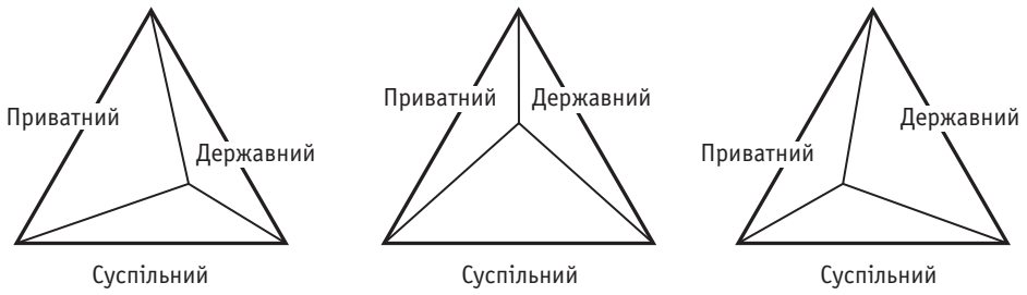
Рис. 2. Взаємодоповняльність компетенції приватного, державного і суспільного секторів

довго, щоби просто вважатися “переходом”. Наприклад, деякі сфери компетенції можуть залишатися “непокритими”, оскільки і держава, і приватний сектор вважають, що це сфера відповідальності іншої сторони. У другій ситуації виявляється розрив між обіцяною послугою і способом її надання. Іноді це відбувається просто через бюрократичні нюанси, коли потребу визначено, гроші для її задоволення виділено, але не можна обійтися без підписів, тож знадобляться роки, щоб подолати всі перешкоди для належної реалізації завдання. Утім, це може бути пов’язане і з третьою ситуацією , коли держава не в змозі розв’язати поставлене питання і просто виходить із гри (або так і не вступає в неї). Це трапляється, коли надання послуги надто дороге або ж бракує зацікавленості й усвідомлення необхідності реагувати на певну потребу. Кейс-стаді в цій статті найтісніше стосується останніх двох сценаріїв (табл.).