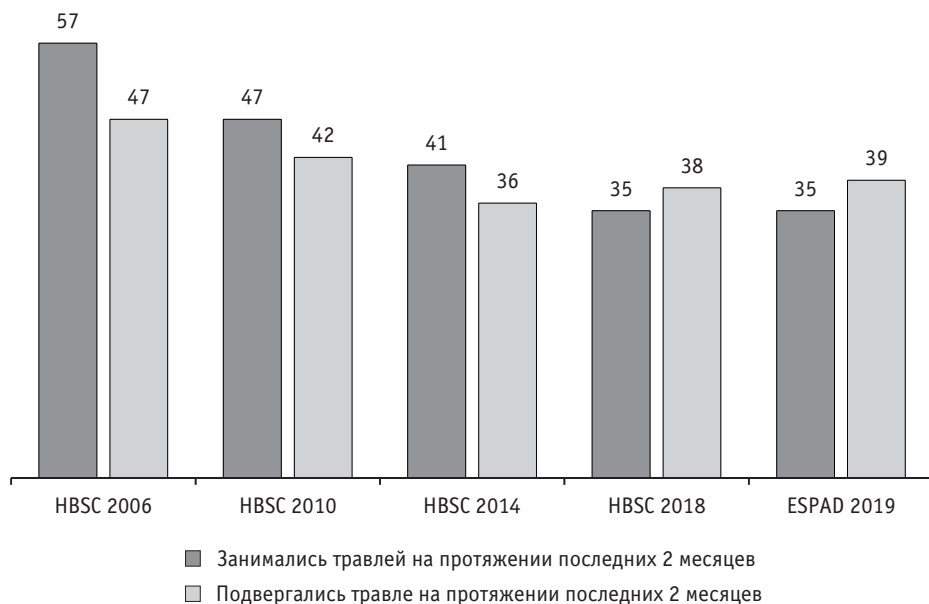
Рис. 1. Динамика уровня распространенности буллинга в учебных заведениях Украины по данным HBSC (2006–2018) и ESPAD (2019), %

могут обеспечить гораздо больше социологической информации, чем просто количество обидчиков и жертв.