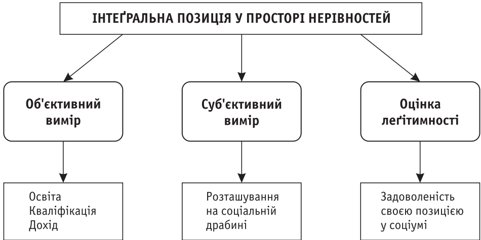
Рис. 2. Вимірювання інтегральної позиції у соціальному просторі

Ця типологія також включала чотири категорії — вища, середня, низька та неузгоджена позиції. Віднесення індивідів до перших трьох із них відбувалося на тих самих засадах, що й у попередній класифікації. Четверта категорія включала не лише тих, у кого розміщення за всіма стратифікаційними ознаками не збігалось, а й тих, хто мав неузгоджені позиції в межах об'єктивного виміру нерівності.