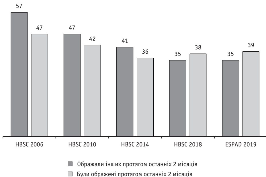
Рис. 1. Динаміка рівня поширеності булінгу в навчальних закладах України за даними HBSC (2006–2018) та ESPAD (2019), %

лася п'ята хвиля опитування учнівської молоді в Україні 1 , при цьому блок запитань про булінг було використано вчетверте. Таким чином, можна побачити динаміку за 2006, 2010, 2014 та 2018 роки. В опитуваннях ESPAD дані про булінг наявні за 2019 рік 2 . Згідно з цими даними, з 2006 по 2019 рік спостерігається позитивна динаміка щодо зменшення булінгу в учнівському середовищі (див. рис. 1). Дані, отримані в рамках різних проєктів за 2018 ( HBSC ) та 2019 ( ESPAD ) роки, майже не відрізняються, що засвідчує надійність вимірювання.