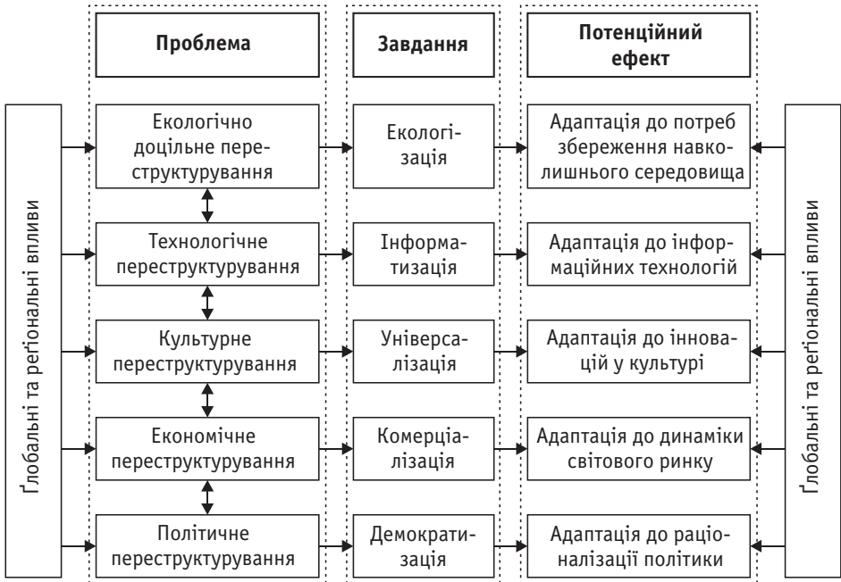
Схема 1. Структурні виміри соціальних трансформацій у Східній Європі

Взаємозалежні розв'язання цих завдань здійснювалися на національному рівні не без впливу глобальних і регіональних процесів (схема 1).